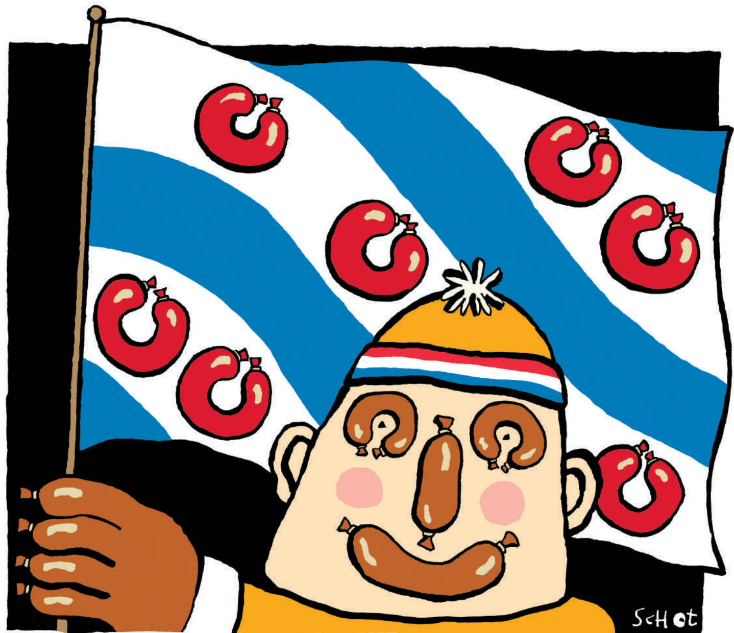
Illustratie Bas van der Schot

Het werpt de vraag op van wie die gezichtsbepalende feestjes eigenlijk zijn. Van het volk of van de sponsor? Publiek dat niet was 'ingeschreven' en geen 2 euro startgeld had betaald aan Unox, werd op het Scheveningse strand niet geduld. De Mobile Eenheid stond paraat om de rechten van de sponsor te beschermen: 'Meneer, u heeft geen vergunning? Dan moeten wij u verwijderen.' Daar sta je dan, 1 januari, midden op het